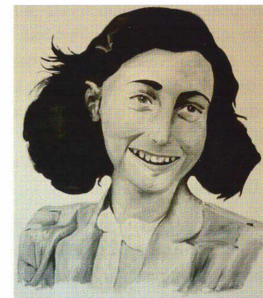
Anne Frank (1929-1945)

„Wie herrlich ist es, dass niemand eine Minute zu warten braucht, um damit zu beginnen, die Welt langsam zu ändern!“